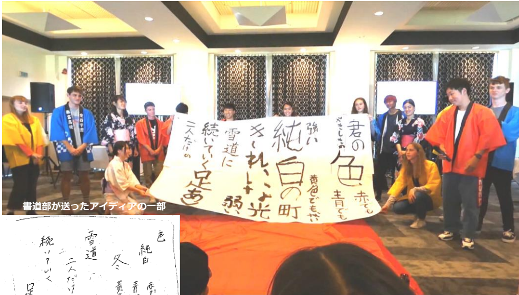
書道部が送ったアイデアの一部

カシミア高校からうれしい便りが届きました。この写真には、昨年12月に短期留学で来校した生徒が写っています。南高校で共に過ごした時の笑顔が思い出されます。