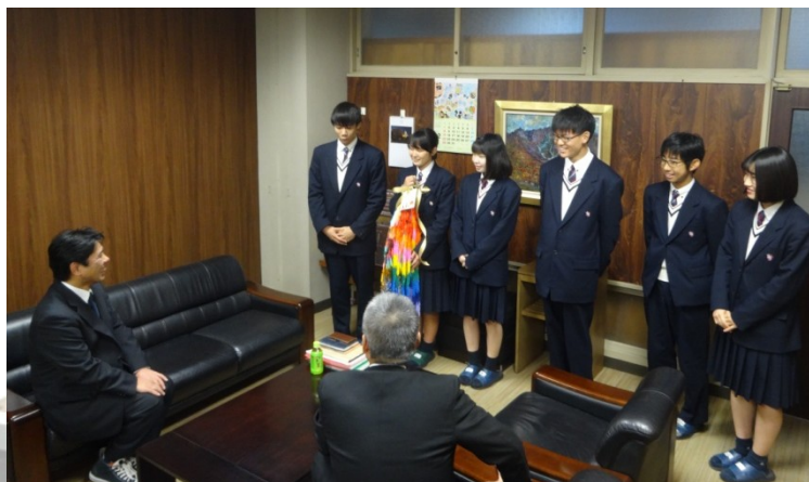
校長先生と PTA 会長さんに生徒会が千羽鶴を広島へ送ることを報告

倉敷支援学校と本校の生徒が折った鶴に、保護者の方々が折った鶴を加えて一つにまとめました。これらの折り鶴は、カシミア高生が持って来られた鶴とともに平和記念公園に供えてもらう予定です。